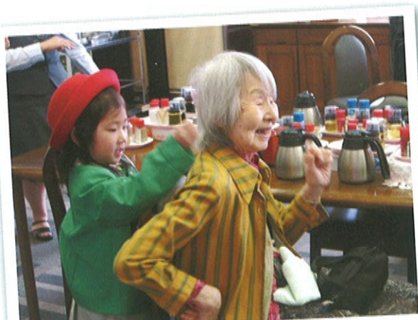
若草幼稚園との交流会