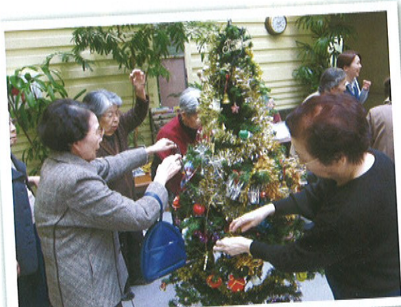
クリスマスツリーの 飾り付け