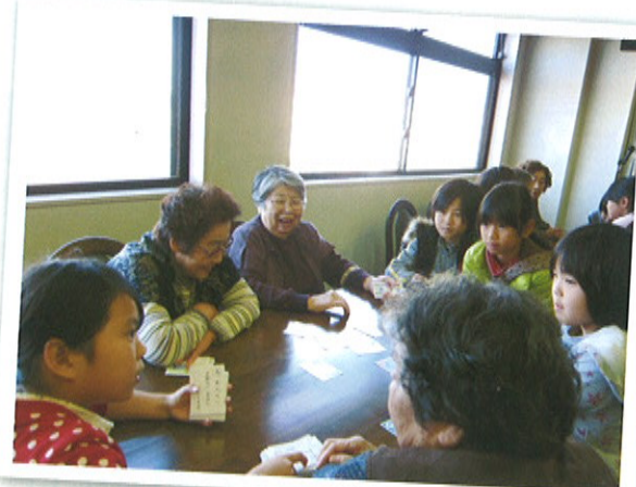
駛馬北小学校3年生との 交流会