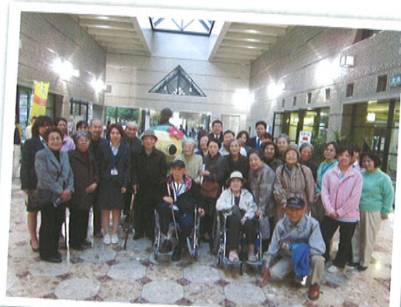
日帰り旅行 「綾小路きみまろ公演」